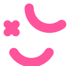
INTELIGENCIA CORPO- RAL Y CINESTÉSICA